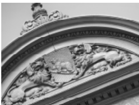
Ornament am Berner Ständeratssessel

Einige Ungereimtheiten im Prozedere, aber scheinbar eine geschlossene Haltung des Ständerates für einen scharfen nationalistischen Kurs. Mitte April wird sich die SPK des Nationalrats mit dem Ergebnis befassen. Für mich geht das Ergebnis an die Grenze der Menschenwürde. Ich will vom EJPD mehr als nur ein scharfes Gesetz. Wir brauchen eine Lösung in der Frage der Sans Papiers. Es muss etwas gehen bei Personenkontrollen und Rückführungen. Und wir brauchen eine Antwort auf die Völkerwanderung aus Armutsgründen.